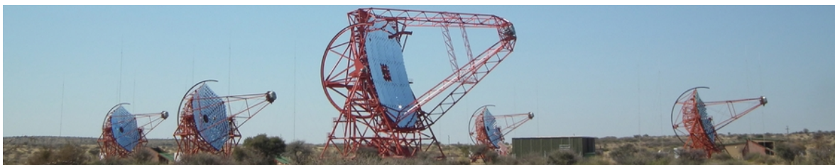
Illustration 1: Le réseau de télescopes H.E.S.S.

L'expérience H.E.S.S.-2 (High Energy Stereoscopic System) [1] est un réseau de télescopes Tcherenkov (Cf. Fig. 1) mesurant des rayons gamma dans le domaine des très hautes énergies (au-delà de \sim 30\text{GeV} ). Cet observatoire est un des instruments au sol les plus performants au monde : grâce à son grand champ de vue, sa bonne résolution angulaire et sa grande sensibilité il permet de détecter et d'étudier l'émission gamma de sources galactiques aux plus hautes énergies. Les objets célestes générant ces rayons gamma de haute énergie sont le siège d'accélération de particules jusqu'à des en énergie dépassant 100\text{TeV} , principalement des électrons/positrons, dont les mécanismes fondamentaux sont l'objet d'intenses études tant sur le plan observationnel sur l'ensemble du spectre multi-longueur d'ondes que sur le plan théorique.